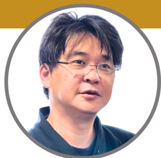
株式会社あみだす 代表取締役

心理カウンセラー/企業研修講師/経営コンサルタント/IT・情報発信コンサルタント