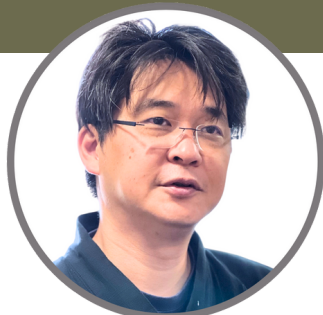
株式会社あみだす 代表取締役

心理カウンセラー/企業研修講師/経営コンサルタント/IT・情報発信コンサルタント